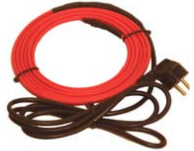
Die Sockelleistenheizung ist erhältlich ab einer steckerfertigen Länge von zwei Metern. Das Anbringen ist ein Kinderspiel: die mitgelieferten Befestigungsschellen an die Wand anbringen und in eine handelsübliche Steckdose anstecken - fertig!

energie, was einer Verbesserung des Wärmehaushaltes der Bausubstanz gleichkommt.“ Aber auch hinter Möbeln bewirkt die Sockelleistenheizung Wunder. Sie erwärmt die gestaute Luft, bringt sie zum Zirkulieren und verhindert dadurch auch dort die lästige Schimmelbildung. Die Sockelleistenheizung gibt es steckerfertig zu kaufen. Sie besteht aus einem Schutzgeflecht mit verzinnemtem Kupfer und einem korrosionsgeschütztem Außenmantel aus Thermoplast. Die Verlegung der Sockelheizung ist kinderleicht. Einfach in Sockelhöhe mit den mitgelieferten Befestigungsschellen an die Wand angebracht und in eine handelsübliche Steckdose angesteckt - schon kann die Heizung ihre volle Wirksamkeit entfalten. Auch eine Verlegung in Ecken ist möglich. Die Heizung erreicht eine Maximaltemperatur von 60 Grad. Da sich in der Heizung ein selbst-