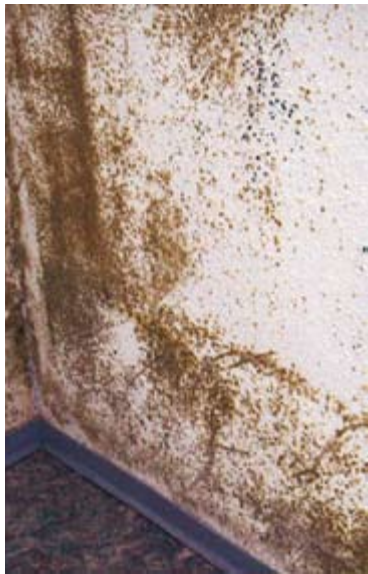
So weit muss es nicht kommen. Schon durch einfache Mittel, wie das Anbringen einer Sockelleistenheizung, kann Schimmelbildung verhindert werden.

Mit Beginn der kalten Jahreszeit haben viele Wohnungen das gleiche Problem: Schimmelbildung an Wänden im Wohnbereich. Das Problem findet man häufiger zwischen Wand und Möbeln, denn dort wird die Luft nicht erwärmt, kondensiert und fördert dadurch eine oberflächliche, gesundheitsschädliche Schwarzsimmelbildung.