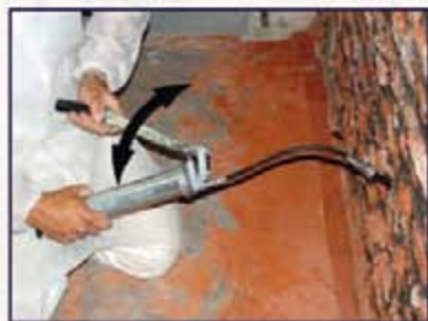
Dichtgel in die Wand pressen